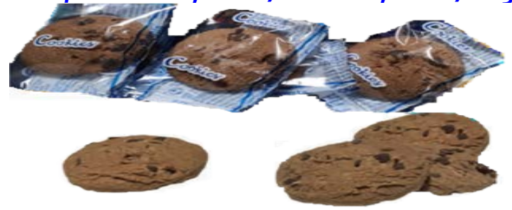
Cookies de Chocolate 1,3 kgs.