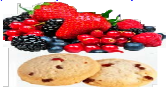
Pastas Frutas del Bosque 1,3 kgs.