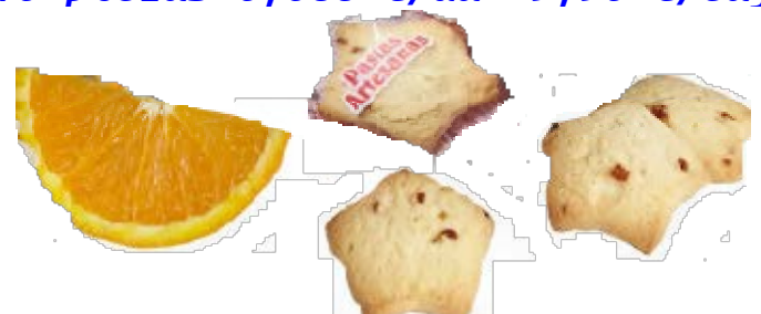
Estrellas de Naranja 1,2 kgs.