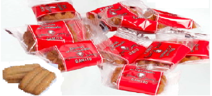
Biscuits de Caramelo 1 kg