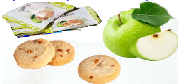
Pastas de Manzana 1,3 kgs.