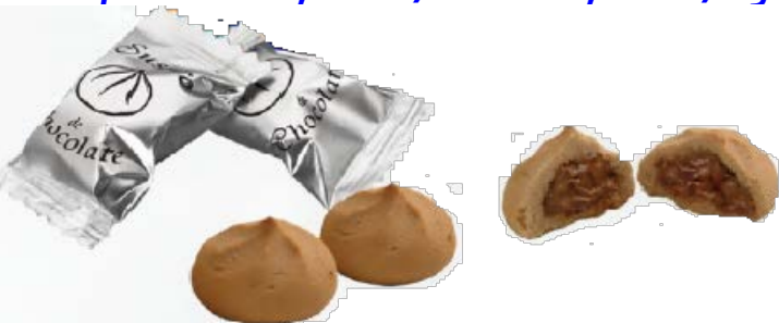
Suspiros Rellenos Cacao 1,3 kgs.