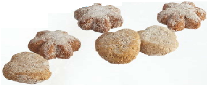
Artesana Flores/Corazones 1 kg.