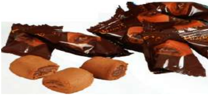
Biscuits de Chocolate 1 kg